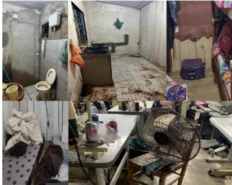
Figura 1- Fotonetnografia da Degradação