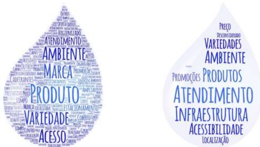
Figura 2. Palavras-chave dos atributos e dimensões da qualidade em supermercados

A Figura 2 ilustra as palavras-chave dos atributos e suas dimensões teóricas mais influentes na percepção dos clientes de supermercados.